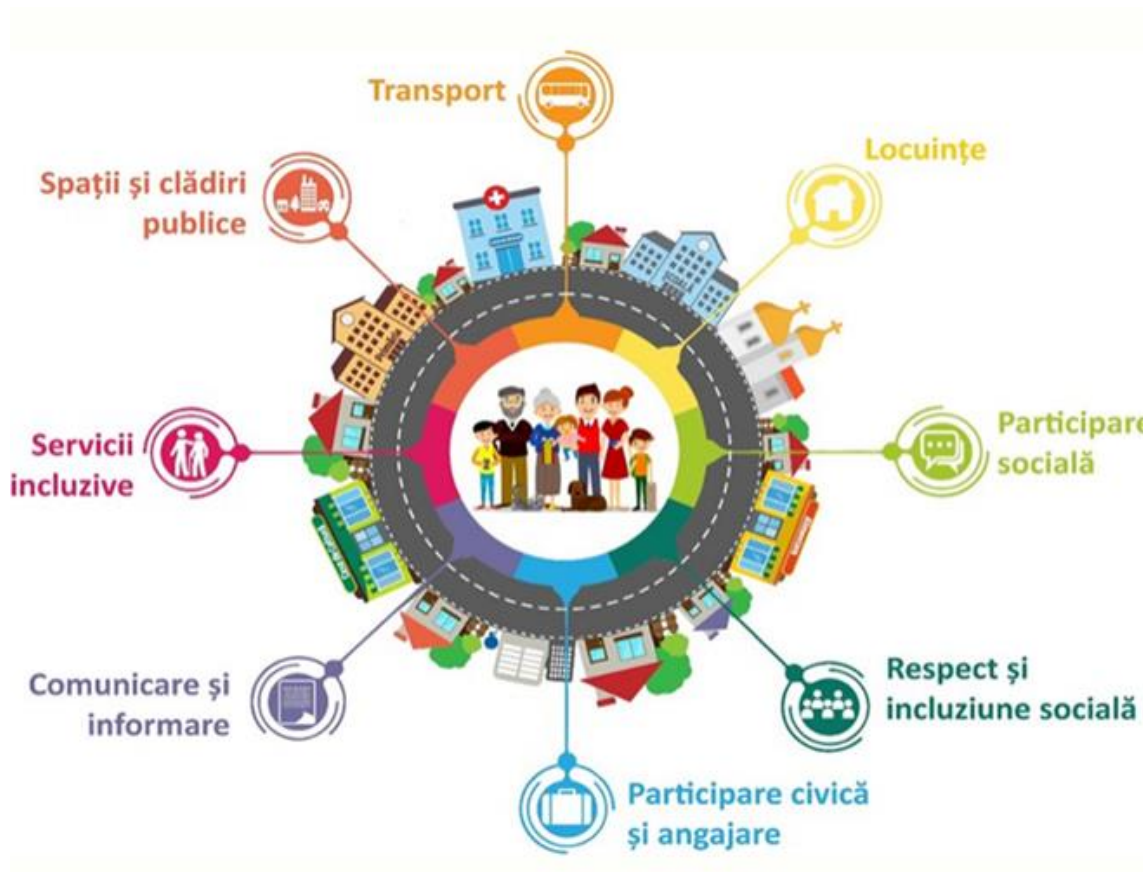
Fig. nr. 3 Caracteristicile comunităților și orașelor prietenoase cu vârstnicii